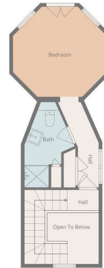
Floor Plan Created By Van Remonijck & Karman | Real Estate Media Measurements Are Highly Reliable, But Not Guaranteed.