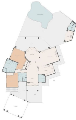
Floor Plan Created By Van Remonijck & Karman | Real Estate Media Measurements Are Highly Reliable, But Not Guaranteed.