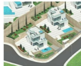
Parcela P1: 564,32 m 2