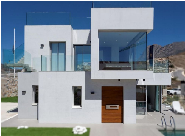
Villa tipo C