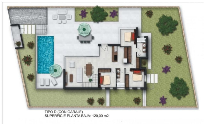
TIPO D (CON GARAJE) SUPERFICIE PLANTA BAJA: 120,00 m2