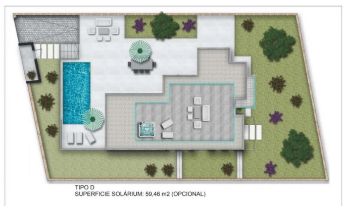
TIPO D SUPERFICIE SOLÁRIUM: 59,46 m2 (OPCIONAL)