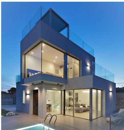
Villa tipo B