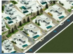
Villa tipo D (CON GARAJE)

Parcela 548,26 m2 Parcela 543,85 m2 Parcela 535,16 m2